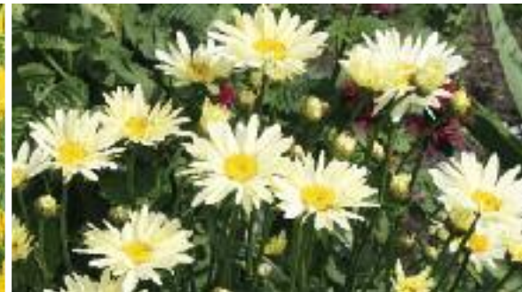
▲ Leucanthemum x superbum 'Broadway Lights' Margerite

Über dem nadelartigen Laub entwickelt sich im Sommer ein gelber Blütenschirm, der selbst an regnerischen Tagen für ein wenig Sonnenschein sorgt.