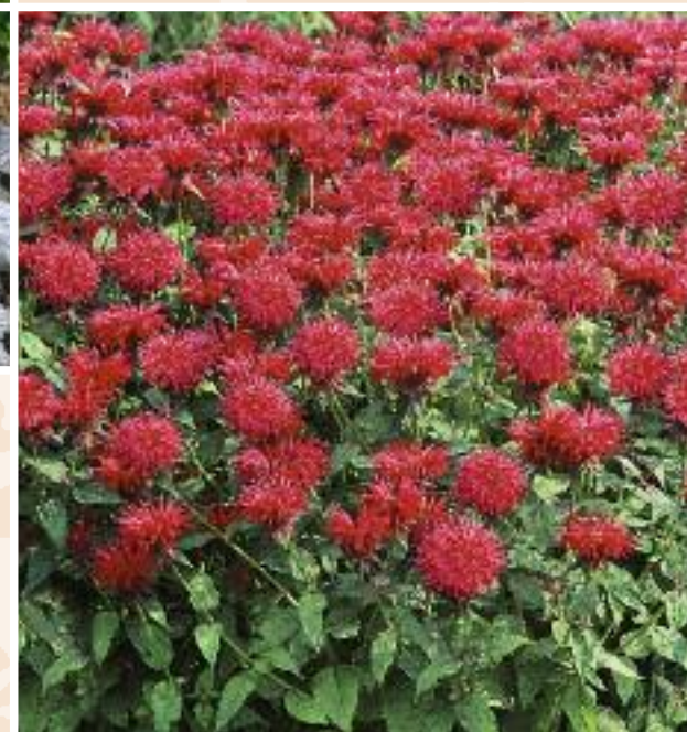
► Monarda fistulosa 'Fireball' Indianernessel

Diese herrliche Staude wertet als kräftiger Farbtupfer halbschattige Plätze wunderbar auf. Auf normalen Böden entwickelt sich die Pflanze rasch zu üppigen Horsten.