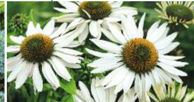
▲ Echinacea purpurea 'PowWow White' Sonnenhut

Diese noch wenig bekannte Sorte kann sich je nach Standort versamen. Mit einem Rückschnitt nach der Blüte wird dies verhindert, dafür wird man mit einem zweiten Flor belohnt.