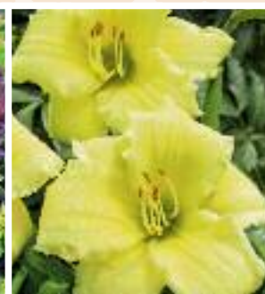
▲ Hemerocallis x cultorum 'Going Bananas' Tagililie

Aus der englischen Staudengärtnerei Blooms of Bressingham stammt diese neue Sorte. Über dem rötlichen Laub öffnen sich im späten Frühjahr goldgelbe Blüten.