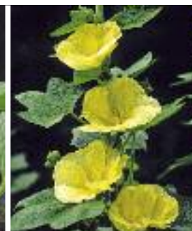
▲ Alcea rosea Spotlight-Serie 'Sunshine' Garten-Stockrose

Diese attraktive Neuheit ist standfest und an günstigen Standorten ausdauernd. Stockrosen bevorzugen trockene bis frische Böden.