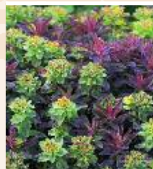
▲ Euphorbia polychroma 'Bonfire' Wolfsmilch

Blütezeit April–Mai Höhe 30 cm Pflanzenabstand 45 cm