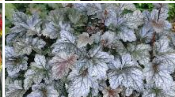
▲ Heuchera micrantha 'Can Can' Silberglöckchen

An sonnig warmen Plätzen gedeiht die Fackellilie mit ihrem wirkungsvollen Farbspiel besonders gut. Bei Kahlfrösten ist Winterschutz ratsam.