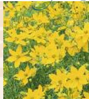
▲ Coreopsis verticillata 'Golden Gain' Mädchenauge

Blütezeit Juli–September Höhe 45 cm Pflanzenabstand 35 cm