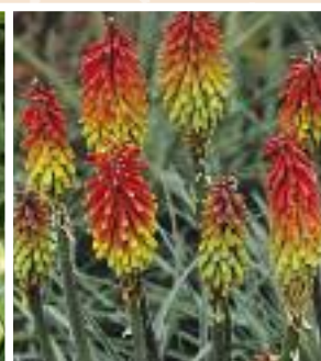
▲ Kniphofia hirsuta 'Fire Dance' Fackellilie

Diese Neuheit überzeugt mit einer langen Blütezeit und als anspruchslose Pflanze. Die Blüten sind essbar und können frisch von der Pflanze geerntet werden.