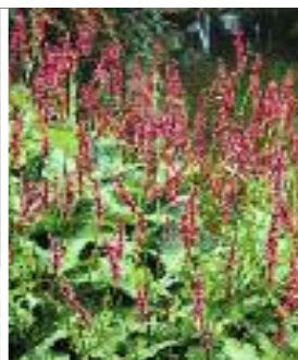
▲ Bistorta amplexicaulis 'Orange Field'® Garten-Kerzenknöterich Blütezeit Juli–Oktober Höhe 100 cm Pflanzabstand 60 cm

Ein Rückschnitt abgeblühter Blütenstände bis zu den oberen Stängelblättern ist zu empfehlen.