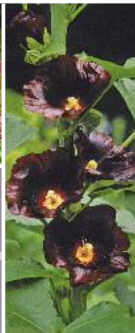
▲ Alcea rosea Spotlight-Serie 'Blacknight' Garten-Stockrose

Blütezeit Juni–September Höhe 180 cm Pflanzabstand 60 cm