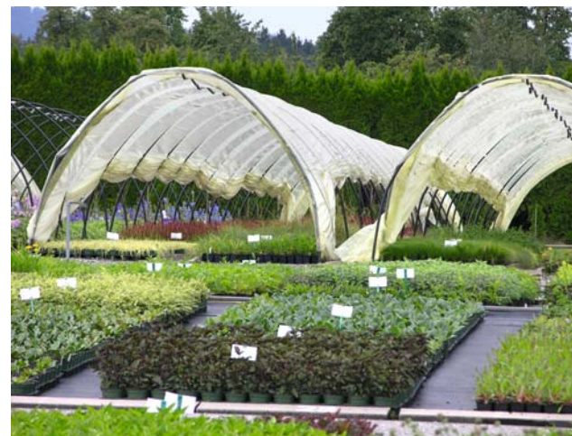
Zum Jubiläum präsentierten sich die Staudenquartiere von ihrer schönsten Seite.

rei ein kleiner ist. Andererseits bin ich stolz, dass ich einen Betrieb mit einer solch langen und erfolgreichen Geschichte führen darf. Für mich sind die Eigenzüchtungen ein Teil unserer Kulturgeschichte, welche wir auch in den letzten zehn Jahren versucht haben zu bewahren. Ein hundertjähriges Unternehmen