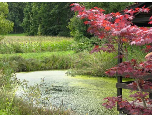
Der Teich mit Pumpenhaus bildet das Herzstück des geschlossenen Bewässerungskreislaufs.