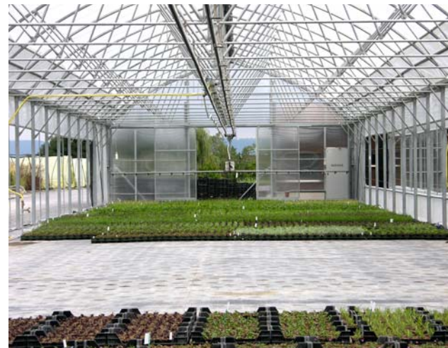
In einem modernen Gewächshaus wird ein Teil der Jungpflanzen selbst produziert.

Einerseits bin ich bescheiden genug zu wissen, dass mein Beitrag an das hundertjährige Bestehen dieser Staudengärtnerei