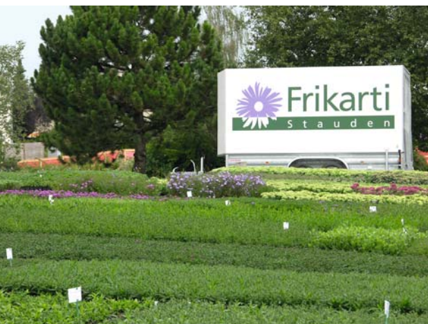
Frikarti produziert inzwischen auf vier ha Fläche jährlich rund eine Million Stauden.