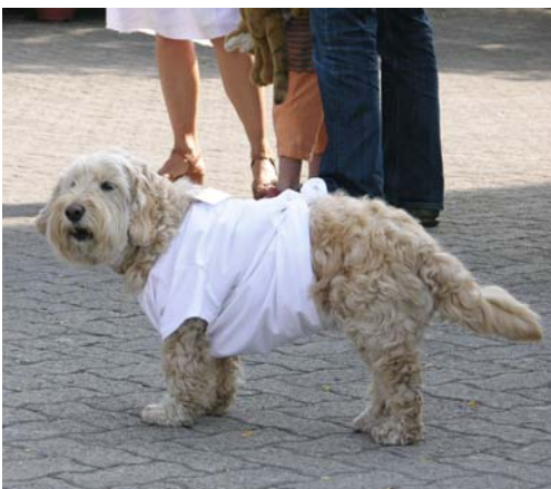
Firmenhündin Mara hatte bei der Begrüssung der Gäste zum doppelten Jubiläum bei Frikarti viel zu tun.