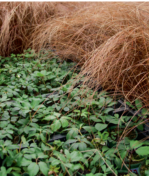
Vorgetriebene Helleborus und Carex comans im Folienhaus.