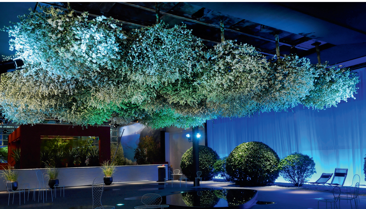
Die Sonderschau «Haute Couture» der Spross Ga-La-Bau AG wurde 2011 mit dem Giardina-Award in Silber ausgezeichnet. Für besonderes Aufsehen sorgten die kopfüber gestellten blühenden Apfelbäume.

Anzucht ausgesuchter Staudenarten genutzt werden. Dazu gehören insbesondere jene Pflanzen, die heikel sind in Bezug auf die Überwinterung oder auf zu viel Nässe, etwa Anemonen, Farne, Helleborus oder Ceratostigma . Dank ausgefeilter Produktionstechniken und optimierten Arbeitsabläufen reichen zwei bis drei Leute, um die 7500 Quadratmeter grosse Fläche zu bewirtschaften. Ein grosser Vorteil ist dabei die Wetterunabhängigkeit. Schon im Februar, während es draussen noch klirrend kalt ist, sind in vielen Töpfen bereits saftiggrüne Triebe zu sehen.