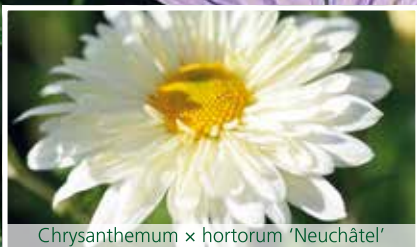
Chrysanthemum x hortorum 'Neuchâtel'