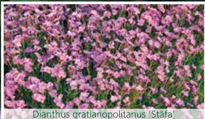
Dianthus gratianopolitanus 'Stäfa'