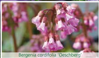
Bergenia cordifolia 'Oeschberg'