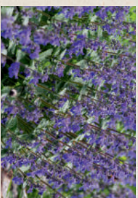
KATZENMINZE Nepeta x faassenii