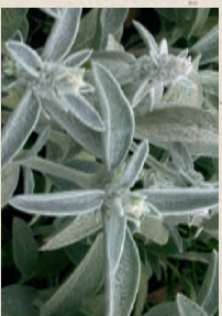
WOLL-ZIESE Stachys byzantina