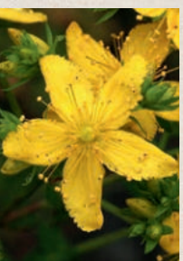
JOHANNISKRAUT Hypericum perforatum