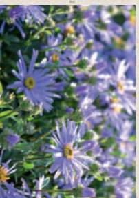
ASTER Aster amellus