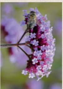
VERBENE Verbena bonariensis