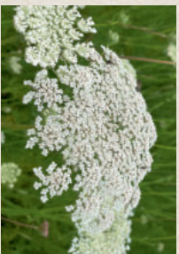
WILDE MÖHRE Daucus carota