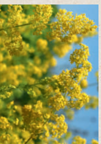
ECHTES LABKRAUT Gailium verum