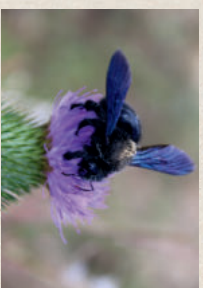
ZIER-DISTEL Cirsium rivulare