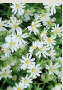
GROSSE STERNMIERE Stellaria holostea