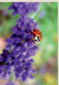
LAVENDEL Lavandula angustifolia