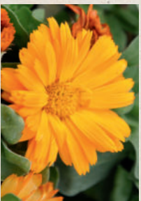
RINGELBLUME Calendula officinalis