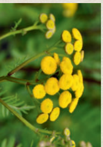
RAINFARN Tanacetum vulgare

Alles für das Chäferfäscht in deinem Garten