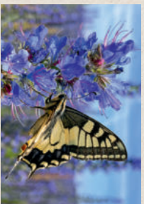
NATTENKOPF Echim vulgare